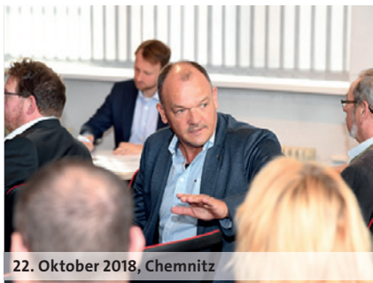
22. Oktober 2018, Chemnitz