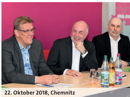
22. Oktober 2018, Chemnitz