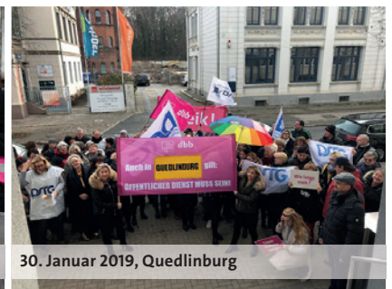
30. Januar 2019, Quedlinburg

Finanzminister Schröder erwarten wir, dass das Volumen des Tarifergebnisses zeitgleich und systemgerecht auf die Beamtinnen und Beamten im Land und in den Kommunen übertragen wird. Mit unseren Aktionen heute haben wir den Arbeitgebern klargemacht, dass wir – Tarifbeschäftigte und Beamte – in der Einkommensrunde als ein Block zusammenstehen.“