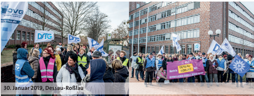
30. Januar 2019, Dessau-Roßlau