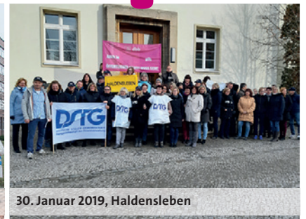
30. Januar 2019, Haldensleben