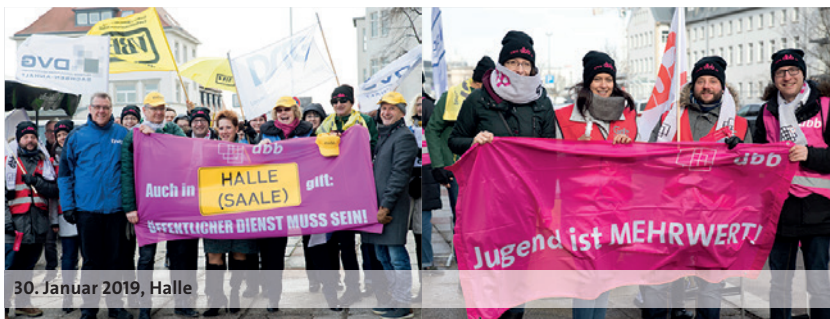
30. Januar 2019, Halle