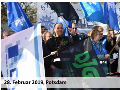
28. Februar 2019, Potsdam

Die Angleichungszulage wird zum 1. Januar 2019 von bisher 30 Euro um 75 Euro auf 105 Euro erhöht. Auch in der nächsten Einkommensrunde werden weitere Angleichungsschritte verhandelt. Schon nach Abschluss der aktuellen Einkommensrunde wollen die Tarifpartner wieder über die Weiterentwicklung der Entgeltordnung für Lehrkräfte reden.