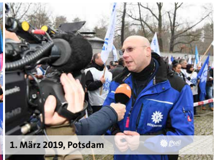
1. März 2019, Potsdam